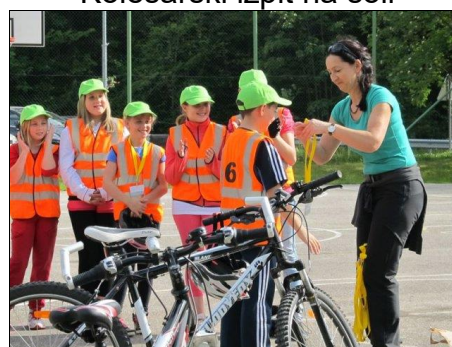
Slavnostna podelitev kolesarskih izkaznic