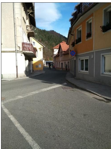
Prometni znak "prepovedano ustavljanje in parkiranje" nameščen neustrezno (pre-kratka razdalja)