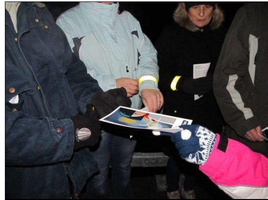
Bodi viden- bodi pre viden (akcija)