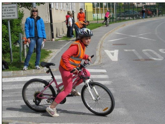
Kolesarski izpit na šoli