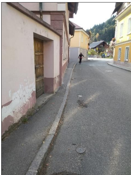
Zelo ozek pločnik (zraven cvetličarne Pušlc v Centru Črne)