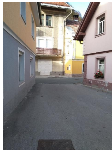
Nepregledno križišče (izvoz-Pumpas)- ni prehoda za pešce, avto pa mora zapeljati na glavno cesto