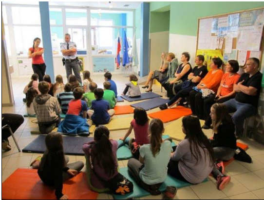
Bistro glavo varuje čelada (delavnice)